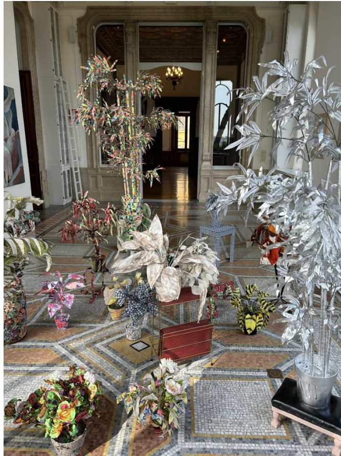
Photo prise lors de l'exposition "A different kind of furs" - Klodin Erb - Istituto Svizzero - Roma