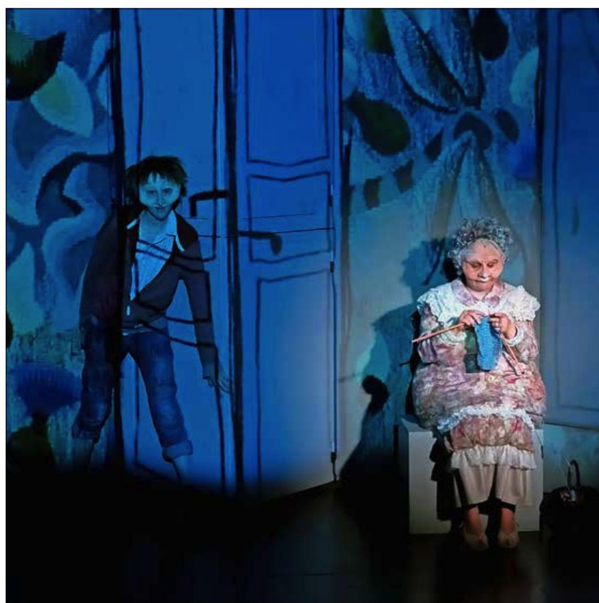
Une mamie pas si ennuyeuse que ça...

La pièce raconte l'histoire de Milo, 8 ans, qui passe son samedi soir chez sa grand-mère. Il s'ennuie, devant cette tisane qui sent les pieds et un documentaire animalier. Mais il va découvrir que sa morne mamie est en réalité une redoutable chasseuse de monstres. Car oui, les sorcières, trolls et autres êtres maléfiques sont parmi nous, intégrés dans les sociétés locales, clubs de pétanque ou amicale des yodeliers... Du coup, Milo a des soupçons: si son prof de gym hurlait à la mort les nuits de