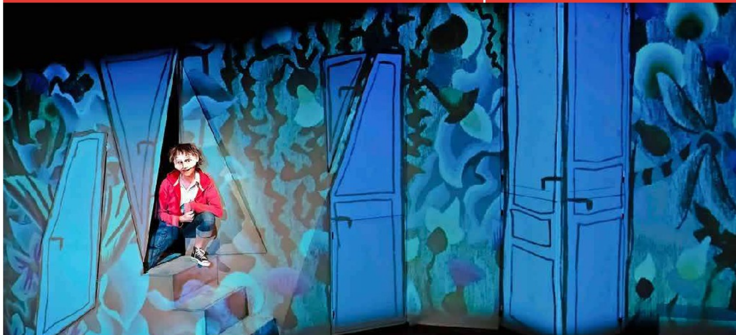
Des projections animent la structure en métal et en bois du décor, tendue de toiles. Sylvain Chabloz

Sylviane Tille met en scène Sans peur, ni pleurs! pour les enfants à partir de mercredi prochain